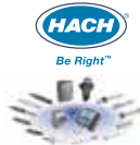
Analizadores de Calidad de Agua, Controladores multiparametros, analizadores de cloro, sensores de conductividad.