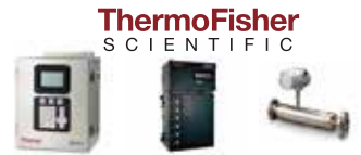
Densitómetros / LIMS / Medidores de Flujo, analizadores de azufre, Espectrómetros.