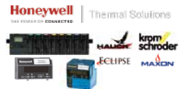
Control de combustión, sistemas de seguridad de llama para calderas y hornos, válvulas para trenes de gas, quemadores.