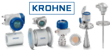
Medición de Caudal y Nivel, sistemas de medición de transferencia de custodia, medidores de flujo, sistemas de detección de fugas.